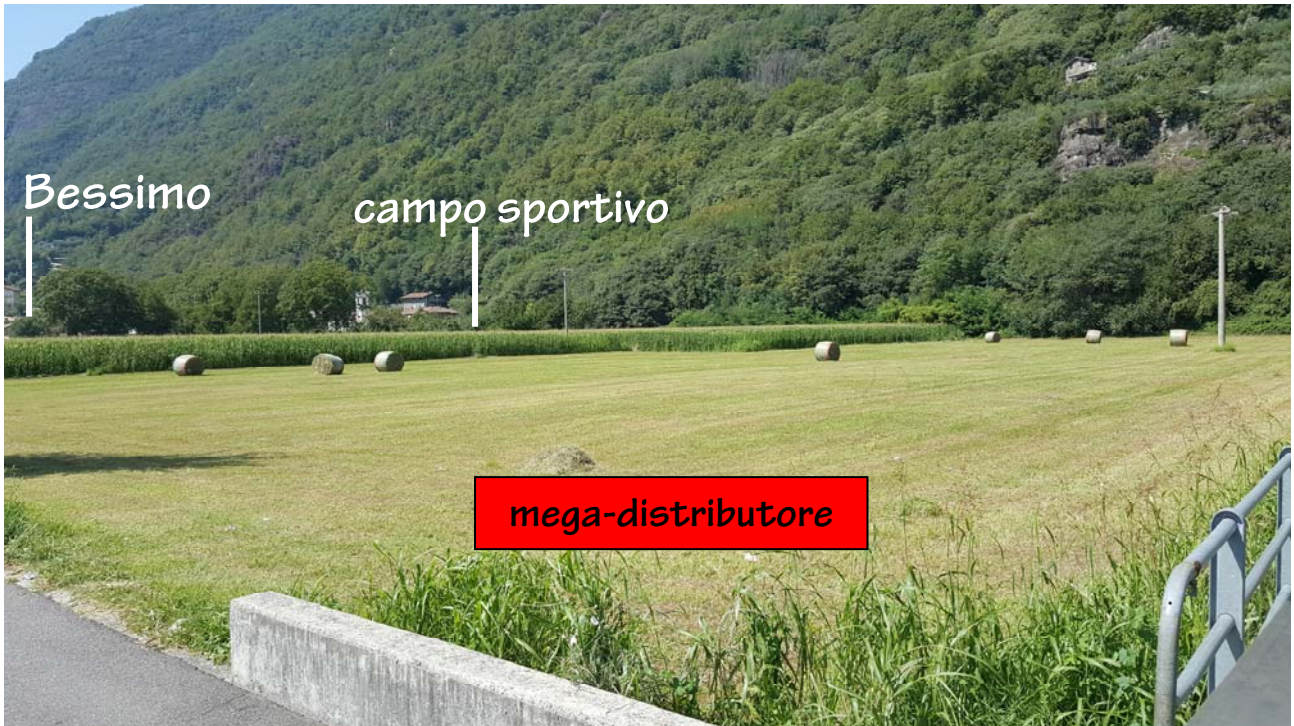
Area interessata dall'intervento